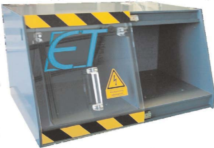
Die Standardgrundabmessungen der Tandem Prüfhaube HPH 4 können optional in Höhe (HE Raster) und Tiefe (50 mm Raster) geändert werden.

Die Tandem Prüfhaube HPH 4 ermöglicht das gleichzeitige Prüfen und Kontaktieren der Prüflinge. Während in der einen Kammer die Prüfung erfolgt, kann in der anderen Kammer der Prüfling entnommen und ein neuer kontaktiert werden. Die Acrylhaube wird einfach von der einen zu der anderen Kammer geschoben. Ein Freiraum hinter den Kammern ermöglicht den Einbau von z.B. Hochspannungsrelais. Je Kammer ist eine Adapterwechselplatte vorhanden. Die Haube kann auf einen Tischarbeitsplatz gestellt werden, ist aber auch für den Einbau in einem Doppel 19" Rack konzipiert.